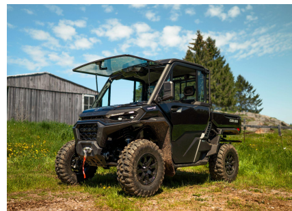
Utilitaires basses émissions