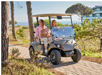
Voiturettes de golf / transport de personnes